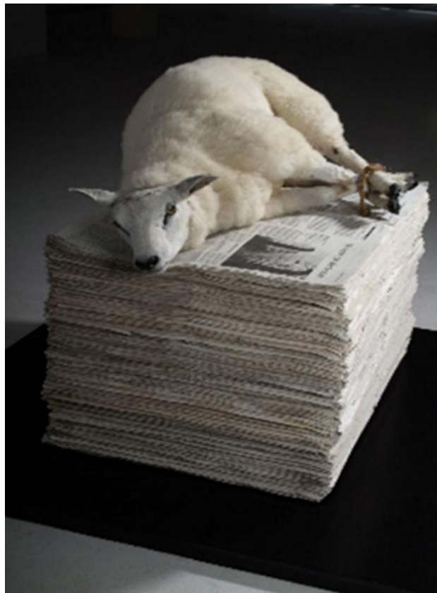
Lam Gods - Willem Zijlstra