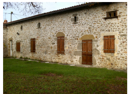
Geen weet van wat zich daarbinnen afspeelt...

Er is een weten van de geheime dingen zonder die dingen te kennen. Misschien vindt u, net als ik, dat het woord mystiek maar een vaag woord is. En omdat ik het een belangrijk begrip vind in verband met ons christelijk geloof en de teksten uit het Thomasevangelie, wil ik proberen dat begrip mystiek een beetje uit de doeken te doen.