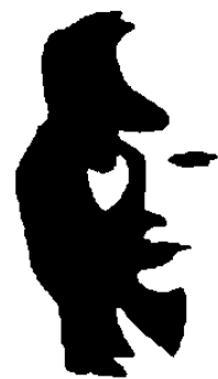
Jonge vrouw of saxofoonspeler?

De betekenis van die woorden van het verhaal zijn nog geheim voor David. Totdat Natan de stilte verbreekt en zegt: “Jij bent die man...” Met een schok komt David tot zelfkennis, als hij zichzelf in het verhaal ziet gespiegeld. U kent wel die plaatjes waar je op blijft staren om te zien wat de ander ziet: de ander ziet een saxofoonspeler en jij ziet het gezicht van een jonge vrouw. Het zit er beide in maar voor het beeld van de ander ben je blind. Dat moet je als het ware geopenbaard worden.