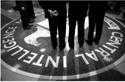
Geheime Dienst: alleen voor ingewijden...

weet men wel van het bestaan van een geheime dienst, maar niet van de inhoud en de werkzaamheden. Ieder geheim, geheimenis, wordt dus door buitenstaanders op z'n minst vermoed... En wie het geheim ook wat inhoudelijk kent is een ingewijde, iemand die de inhoud ervan heeft leren kennen. Als ik