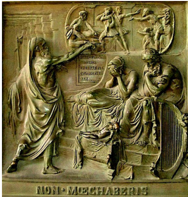
Relief Madeleine Parijs

een poging om de betrouwbaarheid van deze geheime woorden benadrukken. Zo dicht als een tweelingbroer, zo dicht tot Jezus staat de mens die deze woorden doorgeeft. Voor wie zijn deze woorden nu geheim? Daarvoor neem ik u mee terug naar wat we lezen bij Marcus, waar Jezus het heeft over de buitenstaanders, voor wie hij in gelijkenissen , in raadselspreuken spreekt. Een gelijke-