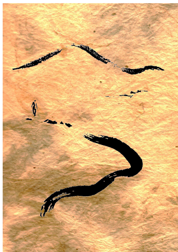
mensen van de Weg...

Ik sluit af met dat woord uit het Johannesevangelie, -Johannes 10, vers 35 dat overigens tegelijk doet denken aan psalm 8. Jezus zegt dan dat de mensen tot wie God spreekt goden genoemd worden. Gods woorden scheppen nieuw leven en maakt mensen deel van zijn goddelijkheid. Zo dragen de goddelijke woorden altijd die geheime kracht in zich om mensen tot het ware leven te bewegen, zodat ze ook zelf het leven voortbrengen. Als de ziel luistert, krijgen alle dingen om ons heen een taal. Gij louter Bron van Eeuwigheidsleven, wij zegenen U. AMEN